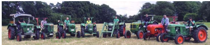
Die Treckerfreunde der Bergfreunde-Schling