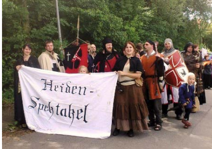
Mittelalterliches Lager mit dem Heiden-Spektakel