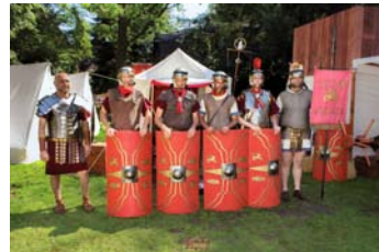
Römer-Lager mit der Legio III Augusta